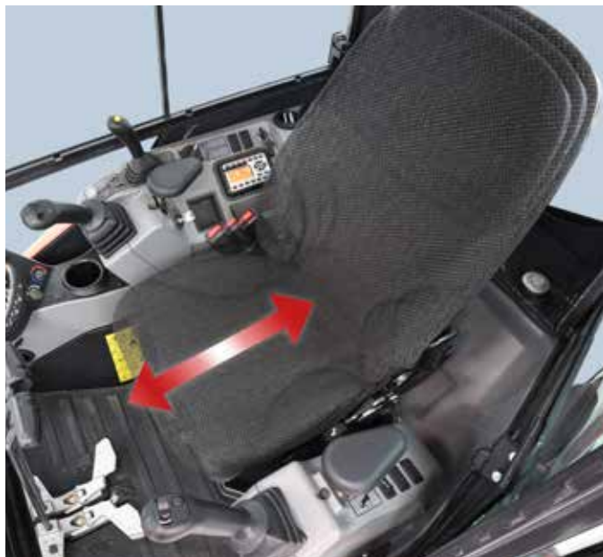
Comodo sedile scorrevole

Il DX27Z è il risultato di un'impostazione progettuale tecnica decisamente innovativa! L'abitacolo è più comodo di quello di qualsiasi altro escavatore nella categoria e il complesso di dotazioni in cabina assicura massimo comfort all'operatore.