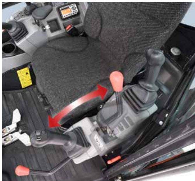
Funzione di inclinazione del supporto comandi